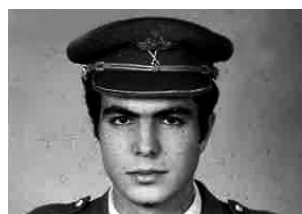
JGA (EX-ALFERES MILICIANO DE INFANTARIA)

A “afirmação” não cura: agrava. Basta de sacrificar jovens em nome de uma mentira. A verdade, por mais incómoda que seja, tem de prevalecer — antes que mais vidas sejam destruídas.