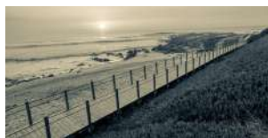
UM PÉ NA TERRA, OUTRO NO MAR