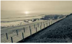
UM PÉ NA TERRA, OUTRO NO MAR