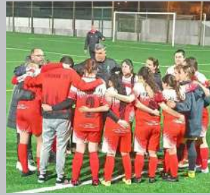
TAÇA FEMININA JÁ TEM FINALISTAS

Nos escolinhas o já campeão Regufe folgou e nos infantis o também já campeão Amorim empatou a dois golos com o Argivai.