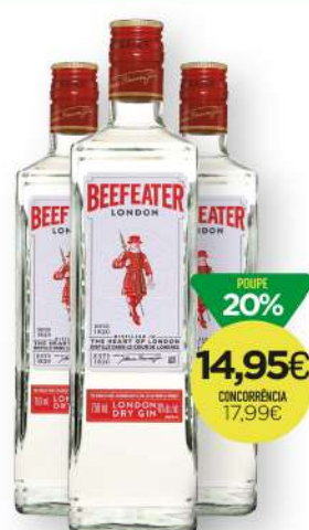
GIN BEEFEATER LONDON 75cl 21,36€/L