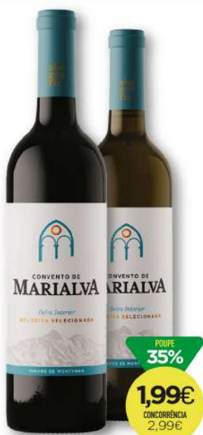
VINHO B. INTERIOR CONVENTO DE MARIALVA Tinto/Branco 75cl 2,65€/L