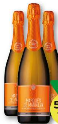
ESP. MARQUÊS DE MARIALVA Blanc de Blancs • Meio Seco 75cl 7,85€/L