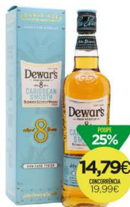
WHISKY DEWAR'S 8 ANOS Caribbean Smooth 75cl 21,13€/L