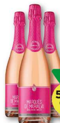
ESP. MARQUÊS DE MARIALVA Rosé 75cl 7,85€/L