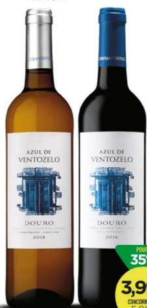
VINHO DOURO AZUL DE VENTOZELO Tinto/Branco 75cl 5,32€/L