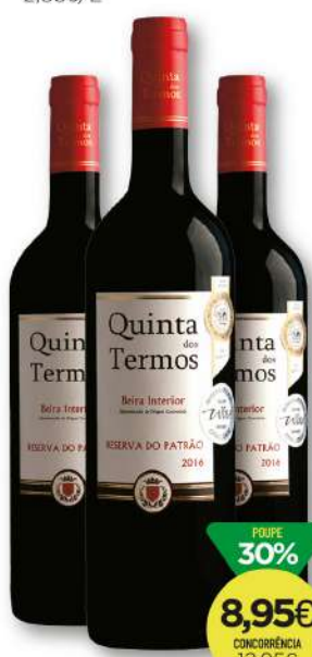
VINHO B. INTERIOR QUINTA DOS TERMOS Reserva do Patrão Tinto 75cl 11,93€/L