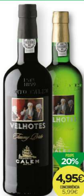
VINHO DO PORTO 3 VELHOTES Tawny/White 75cl 6,60€/L