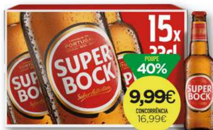
CERVEJA SUPER BOCK 15x33cl 2,02€/L