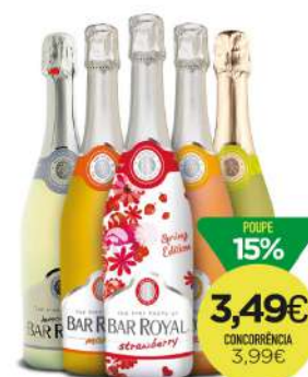
ESPUMANTE BAR ROYAL 75cl 4,65€/L