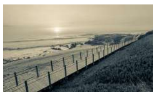
UM PÉ NA TERRA, OUTRO NO MAR