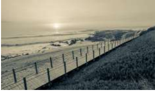
UM PÉ NA TERRA, OUTRO NO MAR