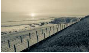
UM PÉ NA TERRA, OUTRO NO MAR