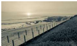
UM PÉ NA TERRA, OUTRO NO MAR