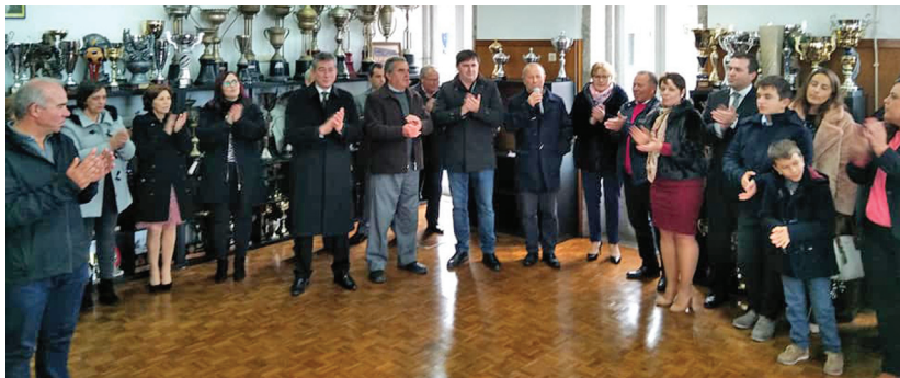
Aniversário do Centro Desportivo e Cultural de Navais