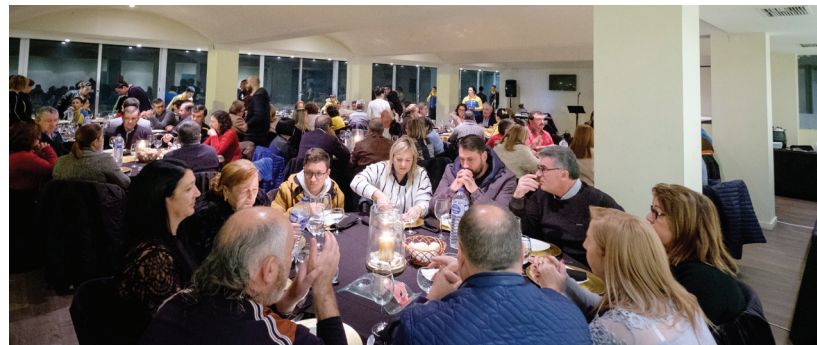
Aniversário do Centro de Desporto e Cultura Juvenorte