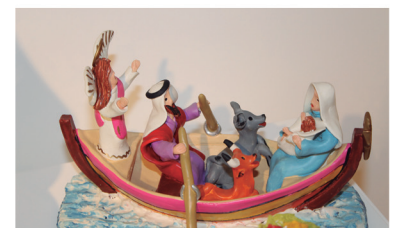
Exposição temporária: Memórias de um Nascimento