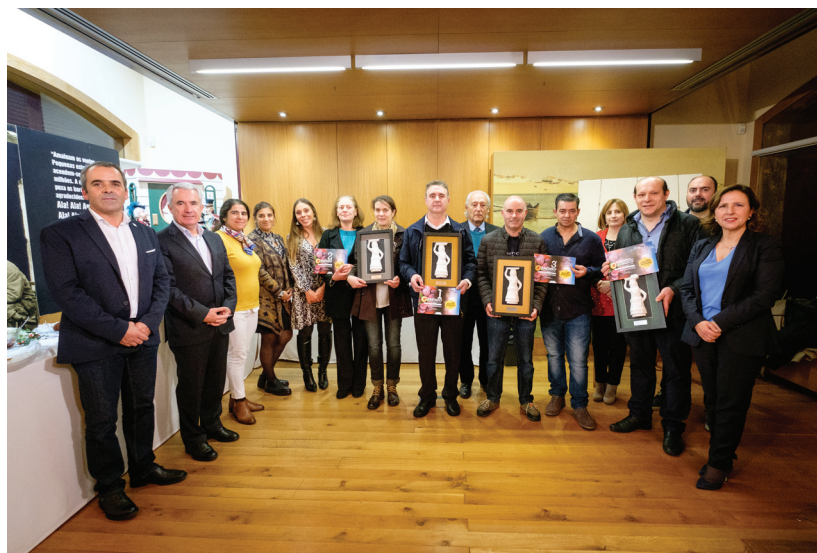
Grupo de Premiados