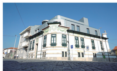
Aberto de terça-feira a sábado, das 14h00 às 18h00