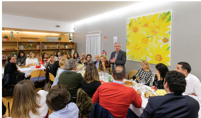
Almoço na Casa do Regaço