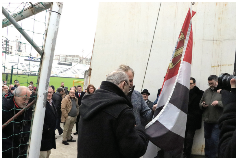
Hastear da bandeira

Sobre as eleições do próximo ano para a escolha de uma nova direção do Varzim, o autarca referiu que "serão