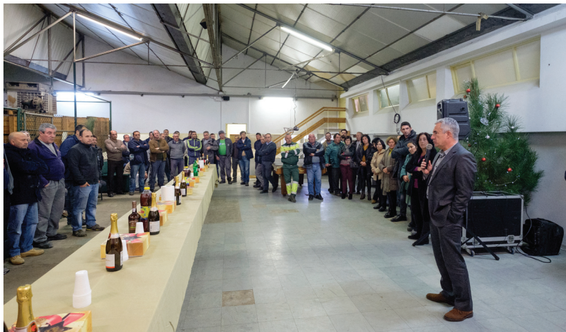
Lanche Convívio com os funcionários dos Serviços Gerais e Horto Municipal