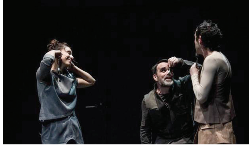
Electra, pela companhia Chapatô

O teatro volta ao palco do Cine-Teatro no dia 30, às 22h00, com a peça "Pozzo – o Porco que dança". Esta co-produção da associação cultural d'Orfeu AC e da companhia Cão à Chuva apresenta-nos um espetáculo cómico, interativo e estranhamente surreal com uma "alegoria do ser politizado e hierárquico num ambiente pós-apocalíptico, onde os porcos são a principal vítima desta catástrofe. A obsessão de Pozzo em comer porcos trouxe a extinção da espécie e como conse-