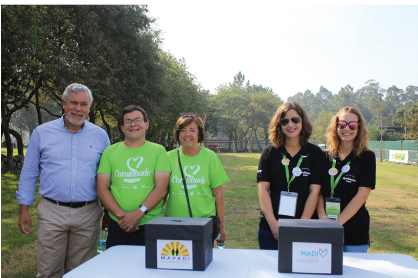
Caminhada solidária a favor do MADI e do MAPADI