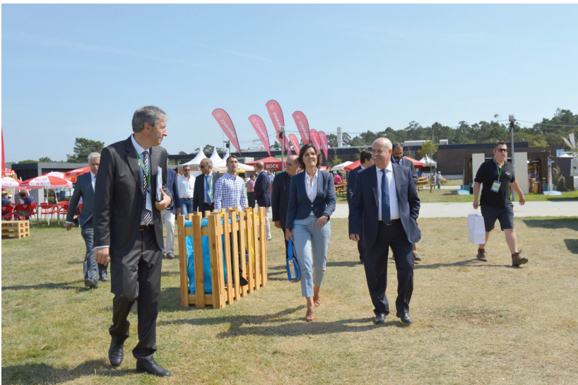
Assunção Cristas e José Fernando Capela

A AgroSemana associou-se também a iniciativas de cariz solidário, casos da Caminhada e Corrida Solidária, realizada no sábado para ajudar as instituições do MADI – Movimento de Apoio ao Diminuído Intelectual (Vila do Conde) e do MAPADI – Movimento de Apoio de Pais e Amigos ao Diminuído Intelectual (Póvoa de Varzim), da Cãomnhada, que teve lugar no domingo e contribuiu com doações para a Cerca – Abrigo dos Animais Abandonados e do Batismo a Cavalo, do Slide e Passeios de Charrete, iniciativas cujos custos simbólicos reverteram para a construção da Casa Acreditar, no Porto, que apoia crianças com cancro e seus familiares.