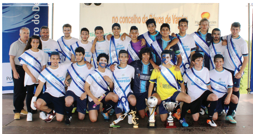
O Estela também conquistou o título no escalão dos Juvenis