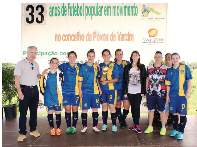
Taça Disciplina dos Seniores Femininos: Navais