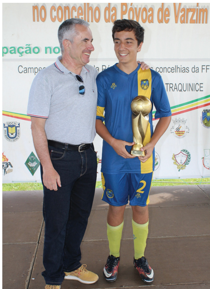
Taça Disciplina dos Juvenis: Navais