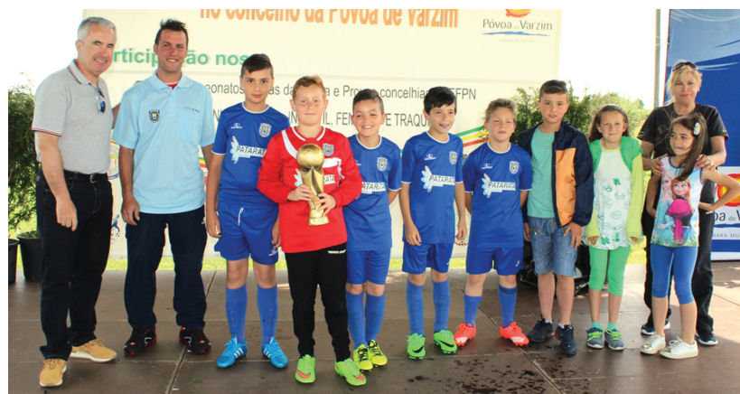
A Taça Disciplina das Escolinhas foi para o Argivai