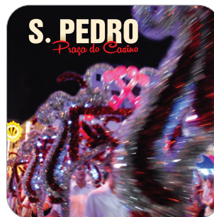
S. Pedro 28 de junho | 22h Praça do Casino