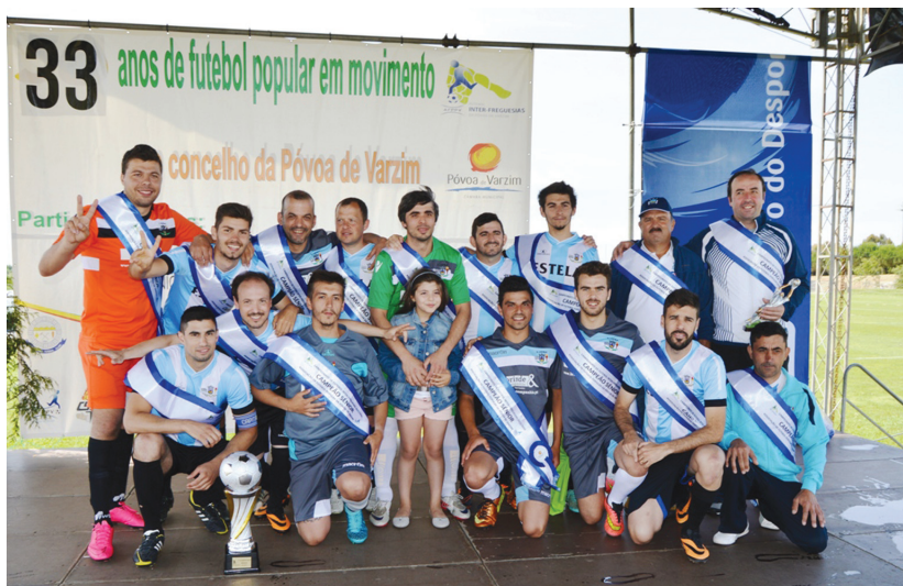
O Estrela foi campeão em Seniores