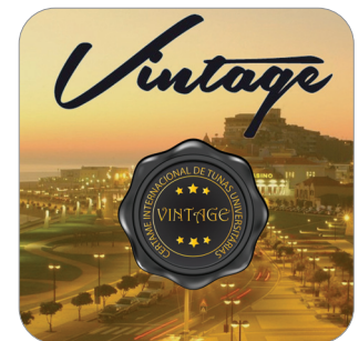
Festival Tunas Vintage 9 de julho | 21h Preço 4,00€