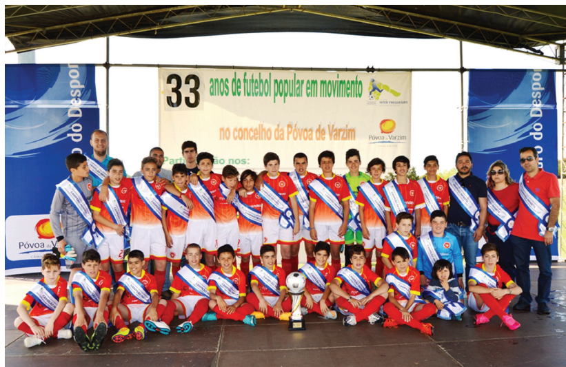
O Balasar foi campeão de Infantis