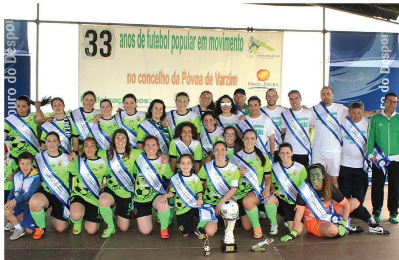
Leões da Lapa, equipa campeã do escalão Feminino

No passado dia 10 de junho, teve lugar a Festa de consagração aos campeões do Inter-Freguesias. Após o campeonato concelhio, é por todos aguardada a festa para celebrar quem mais se esforçou e deu glórias aos seus clubes.