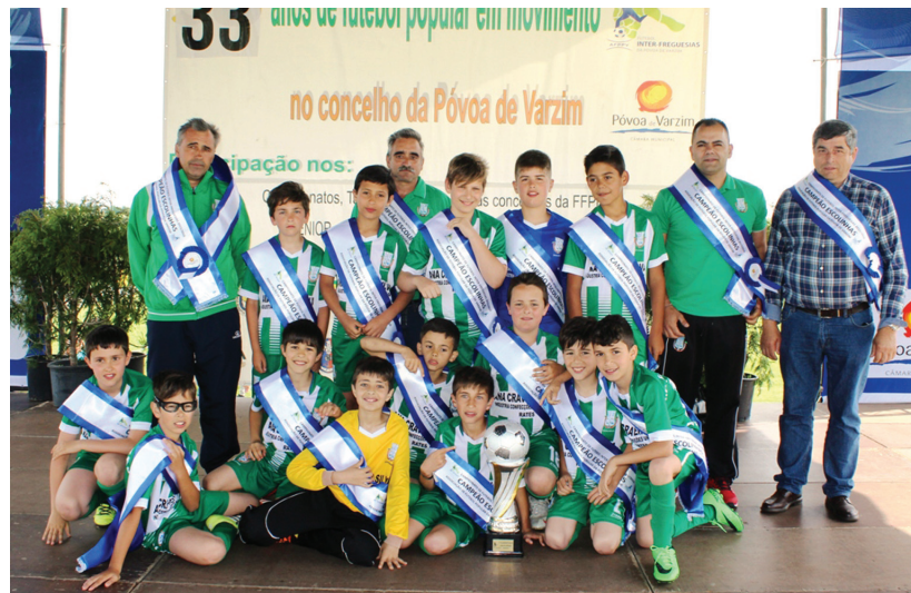
Campeões das Escolinhas, Rates