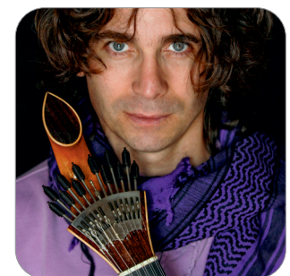
Zé Perdigão 16 de julho | 22h Preço 12,50€