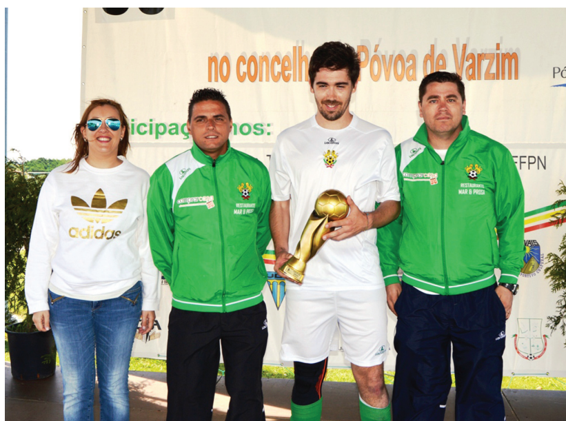
Taça Disciplina dos Seniores Masculinos: Leões da Lapa