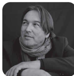
Álvaro Maio 15 de julho | 22h Preço 10,00€