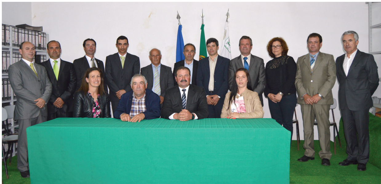
Corpos directivos da Horpozim

Referindo-se à dificuldade que o Presidente da Horpozim disse ter na contratação de pessoas, o autarca afirmou que “estão inscritos no Centro de Emprego, no que diz respeito à Póvoa de Varzim, cerca de 3400 desempregados. Uma taxa manifestamente baixa comparada com aquilo que é a realidade nacional. A vossa contribuição para estes números é muito importante”. A este propósito, o edil constatou