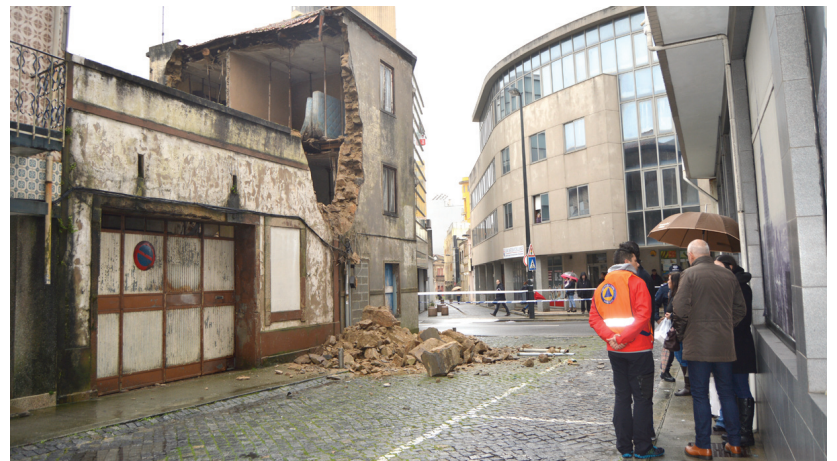
Derrocada de prédio na esquina das ruas Gomes de Amorim e da Vila Velha