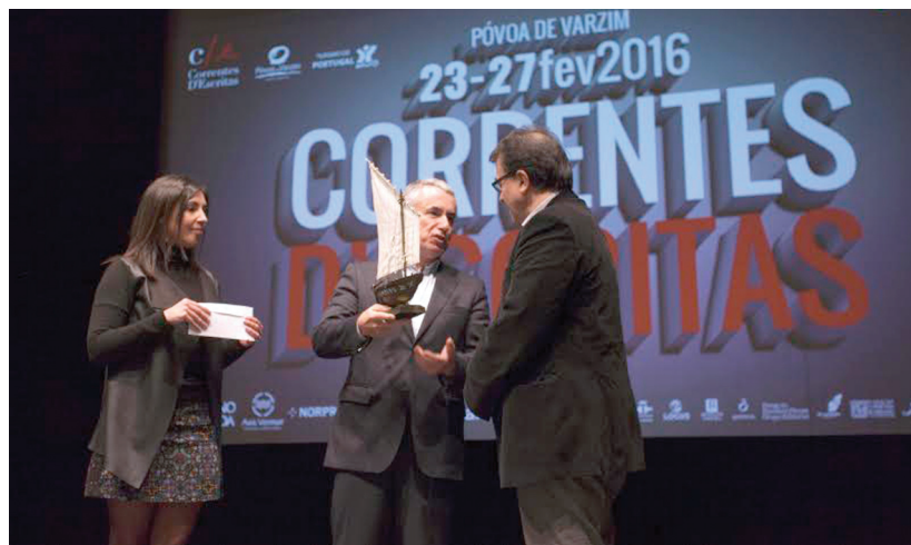
Encerramento do Correntes d'Escritas

O espanhol sublinhou a grande ligação que sempre teve a Portugal por ter nascido junto à fronteira: “a minha família costumava passar férias na Figueira da Foz e era habitual visitarmos Elvas”. Curiosamente, o prémio literário agora recebido deu para perceber que a família Cercas não existe apenas na sua terra, “com as notícias que saíram nos jornais, recebi muitas mensagens e descobri que há Cercas portugueses, o que é maravilhoso”.