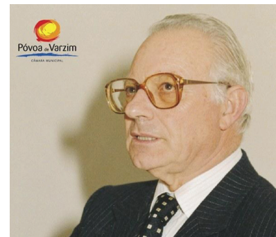
dor, prestou à Póvoa de Varzim e ao seu concelho.