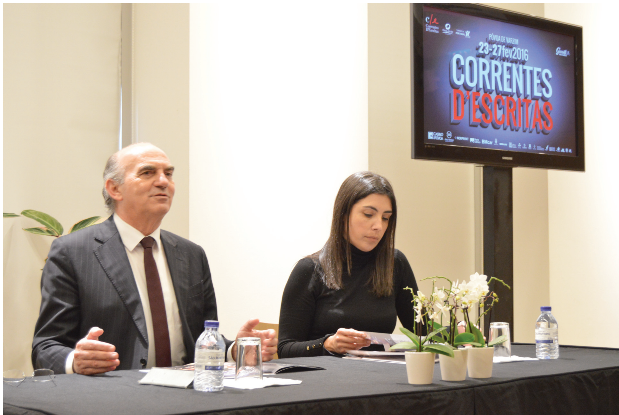
Apresentação Correntes d'Escritas 2016

Para o Vereador da Cultura é entusiasmante constatar que “há um crescendo enorme de participantes/espectadores que se encontram em contacto direto com os escritores, penso que é, de resto, esta a mística do Correntes, em que não há estrelas e todos po-