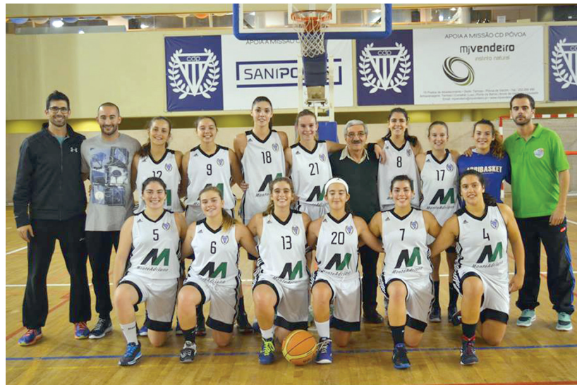
Sub 19 Fem Basquetebol mantém invencibilidade no Campeonato

Na mesma modalidade, a equipa de juniores femininas venceu a forte equipa do Sporting de Braga, num jogo bastante emotivo que foi disputado até à negra. As poveiras que estiveram a perder por 1-2 nunca se deram por vencidas e, com mérito, conseguiram superar a equipa adversária e alcançar uma excelente vitória por 3-2.