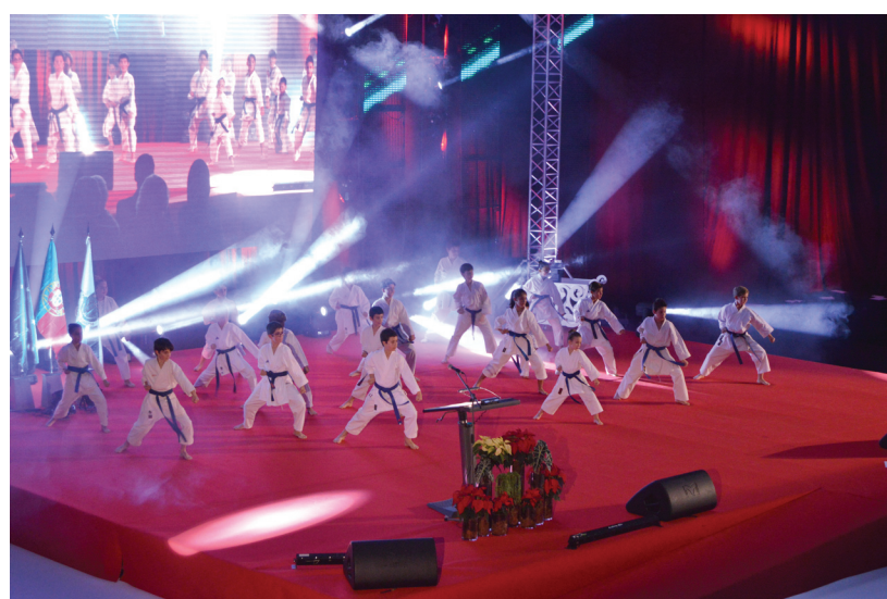
Espetáculo de karaté