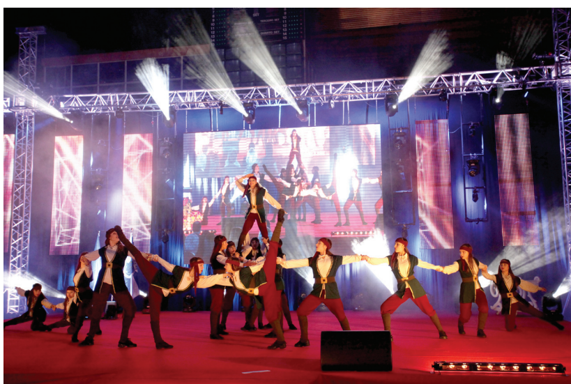
Espetáculo de dança