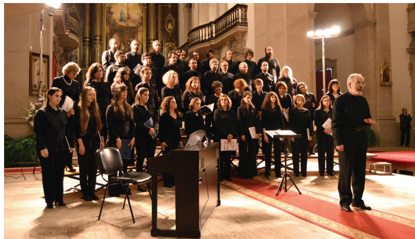
Coral de Letras da Universidade do Porto

O III encontro de Música Coral da Póvoa de Varzim arrancou com igrejas cheias. O público acolheu em grande número, apesar do frio, os coros participantes neste evento organizado pela Associação Cultural Capela Marta, no dia 21, às 21h30, na Basílica do Sagrado Coração de Jesus, e no dia 22, às 16h00, na Igreja de São José de Ribamar.