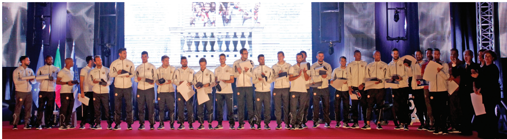
Varzim Sport Club

“Que outra cidade, mesmo grande cidade, pode orgulhar-se de que