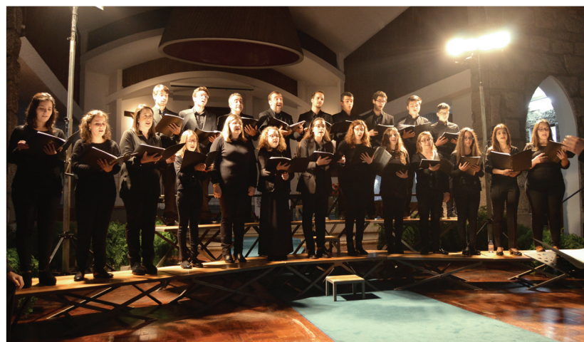
Coro Cantacellis, Barcelos

Os próximos concertos são: dia 28, às 18h00, na Praça do Almada – Coro Feliz Natal Póvoa de Varzim com todos os coros do concelho; dia 29, 16h00, Igreja da Misericórdia – Coro Vivace Música; Ensemble Vocal de Freamunde; Jovens Cantores de Guimarães.