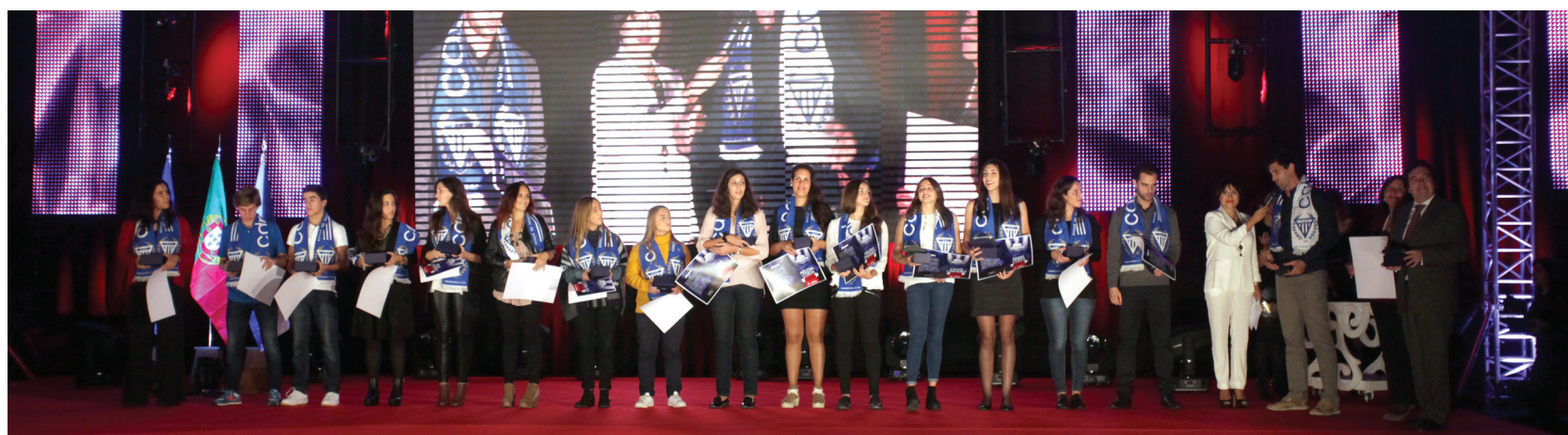
Clube Desportivo da Póvoa