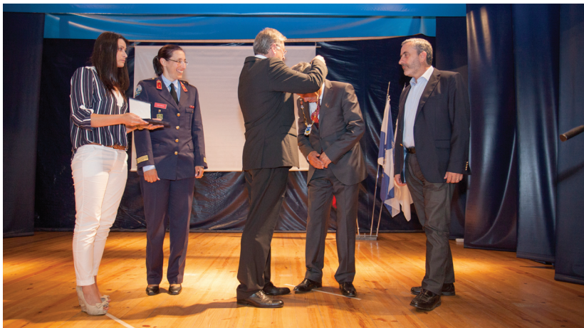
Entrega da Distinção de Mérito Villa Menendi aos Bombeiros Voluntários

A freguesia da Estela encerrou o seu programa comemorativo do 875º aniversário, em cerimónia no último sábado, dia 11, na sede do Grupo Desportivo, Cultural e Recreativo Senhora do Ó, prestando homenagem aos Bombeiros da Póvoa de Varzim.