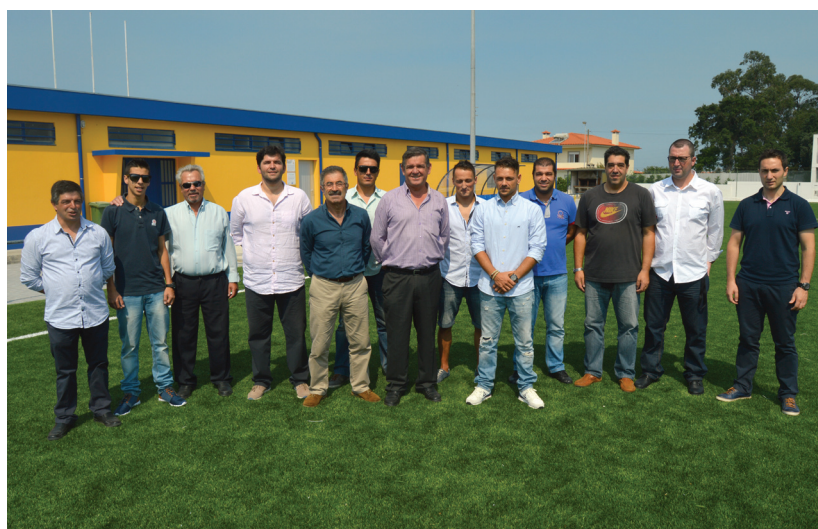
Novos corpos sociais da UD Beiriz

A tomada de posse está marcada para o próximo domingo, dia 26 de julho, pelas 11h00, nas instalações do Estádio de Beiriz.