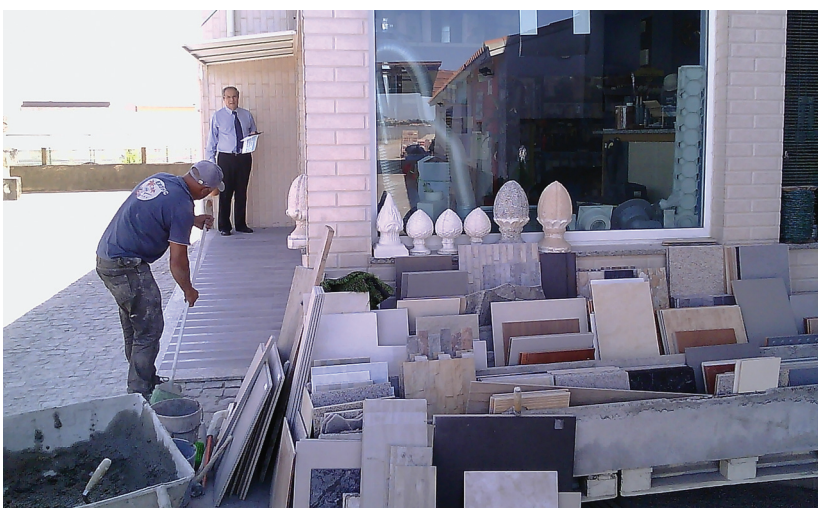
Obras do Comércio Investe