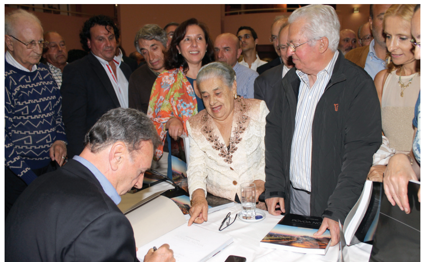
Sessão de autógrafos