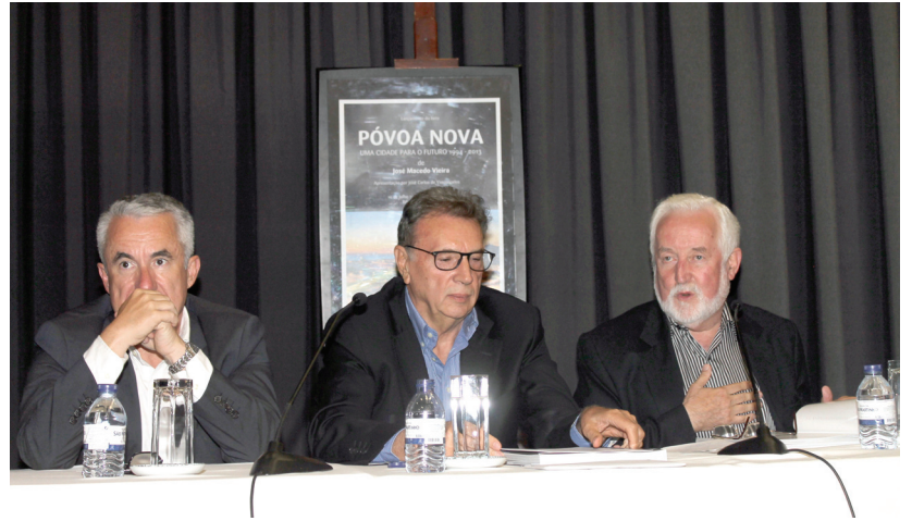
Apresentação do livro

Outro aspeto muito importante que o ex-autarca constatou foi que “conseguimos mudar os hábitos das