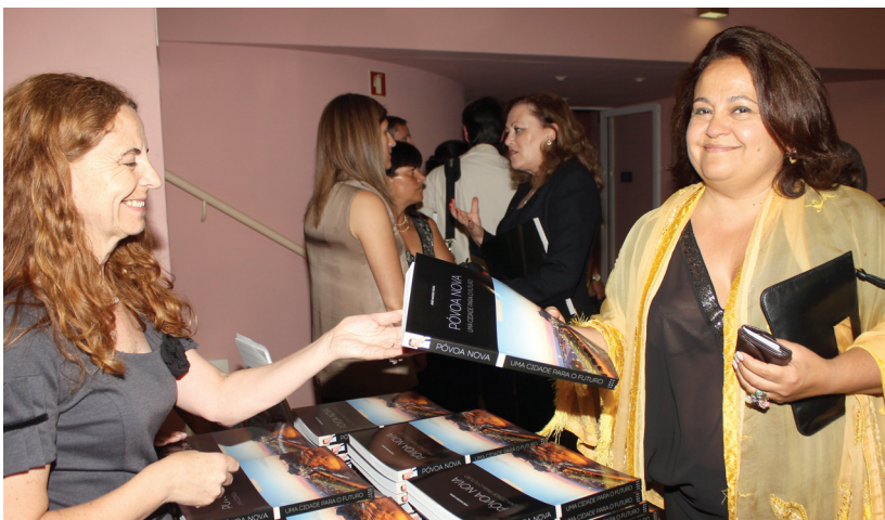
Venda do Livro