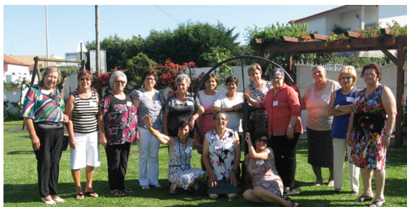
Grupo das antigas alunas da Escola Camões