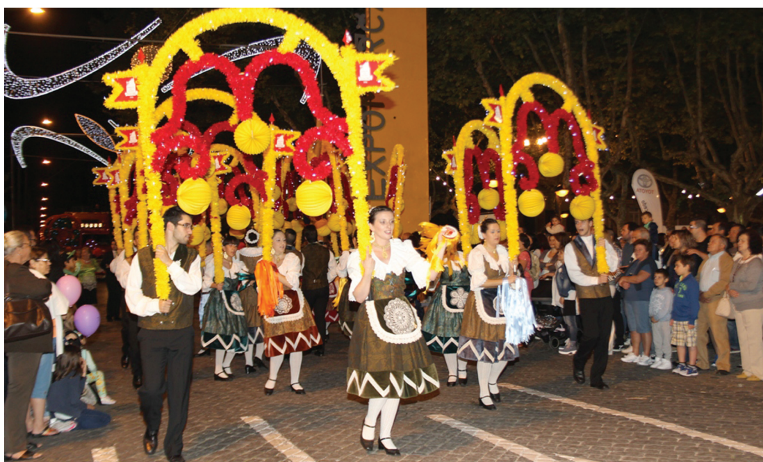
Rancho do Monte

Paralelamente a tudo isto, houve uma série de outras iniciativas, como as cascatas espalhadas pela cidade, a tradicional Feira de S. João com cravos e manjericos, exposições e outros acontecimentos tradicionais.