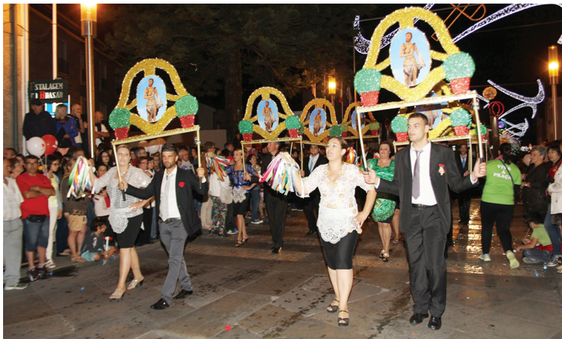
Rancho da Praça

O ponto alto das festas de S. João, em Vila do Conde, decorreu na noite de terça para quarta-feira, com a passagem das Marchas Luminosas e cortejo alegórico dos Ranchos das Rendilheiras da Praça e do Monte.