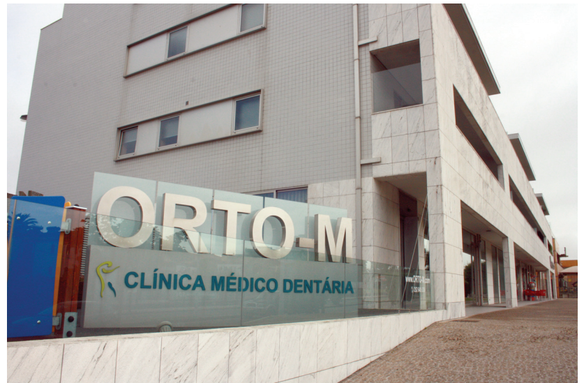
Orto-M foi distinguida pelo IAPMEI

Com um historial de 20 anos, a Orto M caracteriza-se por um crescimento ponderado, com muito foco no trabalho com vista à “qualidade e à orientação para a satisfação dos pacientes, portanto não temos como objetivo crescimento em quantidade”, refere o responsável pela administração do grupo de clínicas, que acrescenta: “A Medicina Dentária é uma área que está em transformação constante e vemos isso