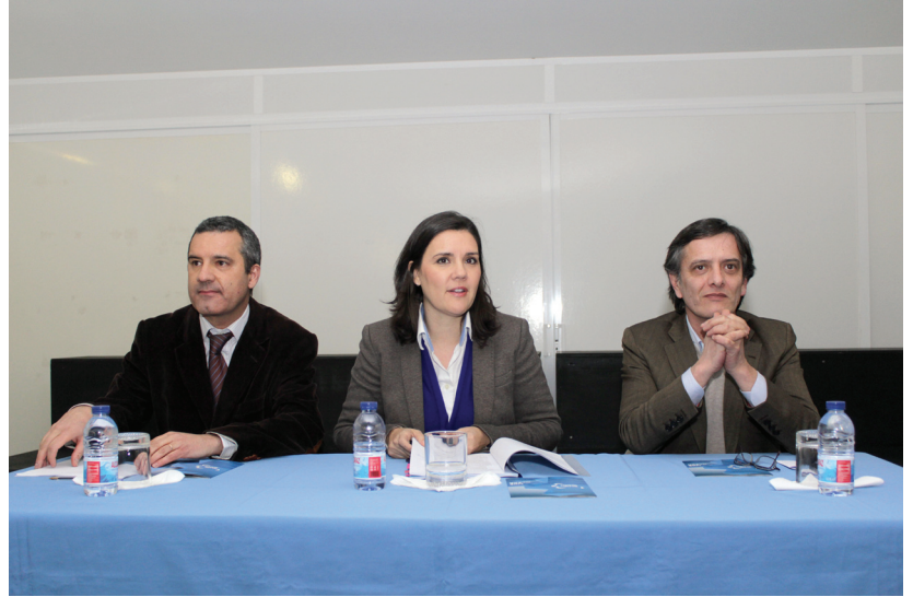
Assunção Cristas (ao centro)

No que diz respeito ao defeso, não há novidades a elencar. A ministra sublinhou que “é essencial, de acordo com o plano de proteção da sardinha, para podermos recuperar a espécie. O defeso realiza-se no período habitual e previsto. Neste aspeto não há novidade”. Porém, a ministra do Mar garante que a salvaguarda da espécie sardinha não está adormecida, revelando que, em paralelo ao defeso, está a ser desenvolvido “um trabalho muito intenso de investigação científica”. Neste âmbito, o governo adquiriu “uma sonda acústica da mais moderna tecnologia para poder fazer uma avaliação o mais rigorosa possível do estado do stock da sar-