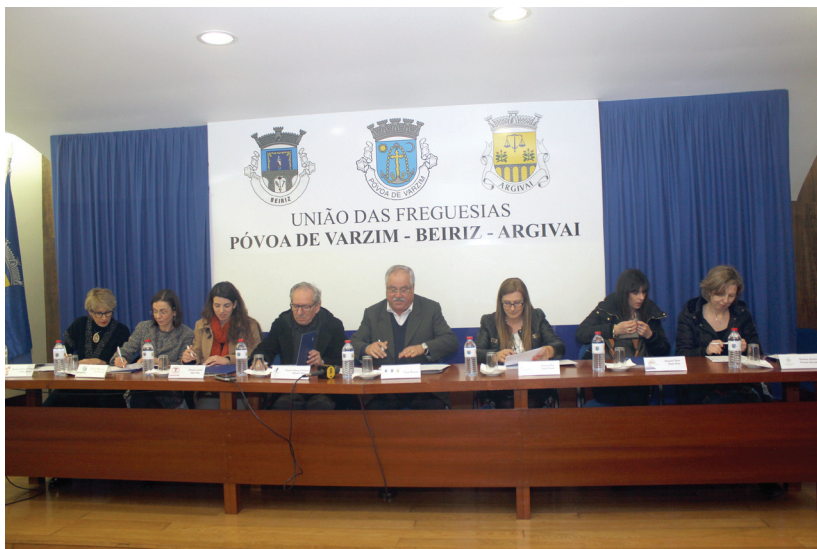
Assinatura dos protocolos