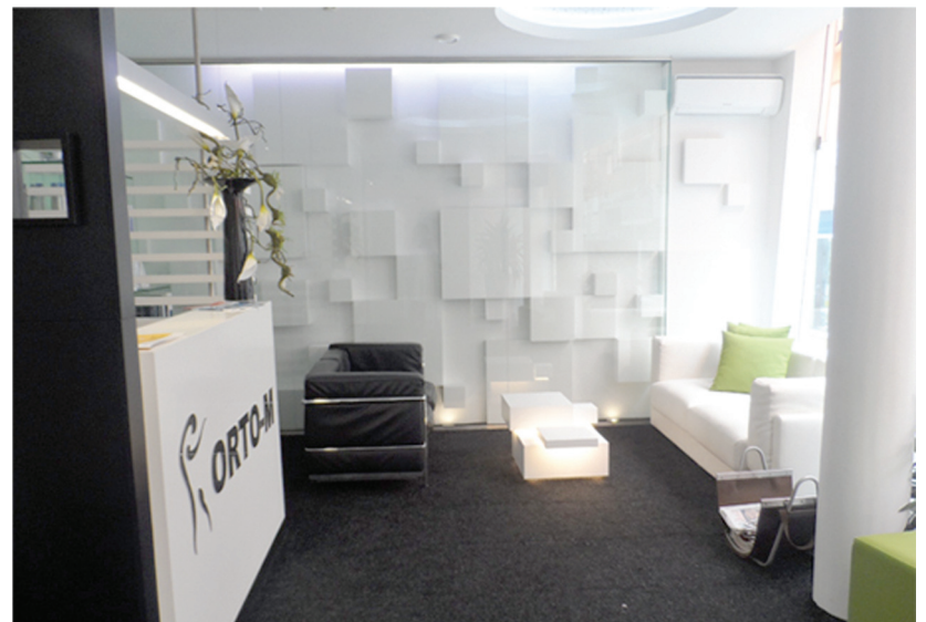
Orto-M Póvoa Sul