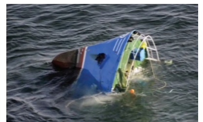
Abril - Naufrágio do Mar Nosso