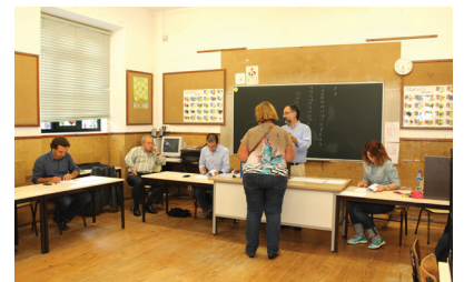
Setembro - Eleições Primárias PS