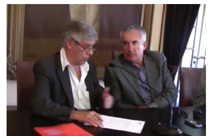
Julho - Contrato dragagem do porto de pesca