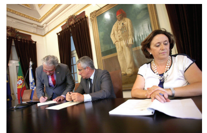
Mai - Conselho Municipal de Segurança