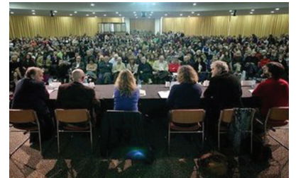
Fevereiro - Correntes d'Escritas