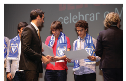
Novembro - Gala do desporto