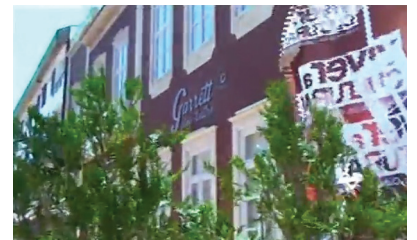
Junho - Inauguração do Cine-Teatro Garrett