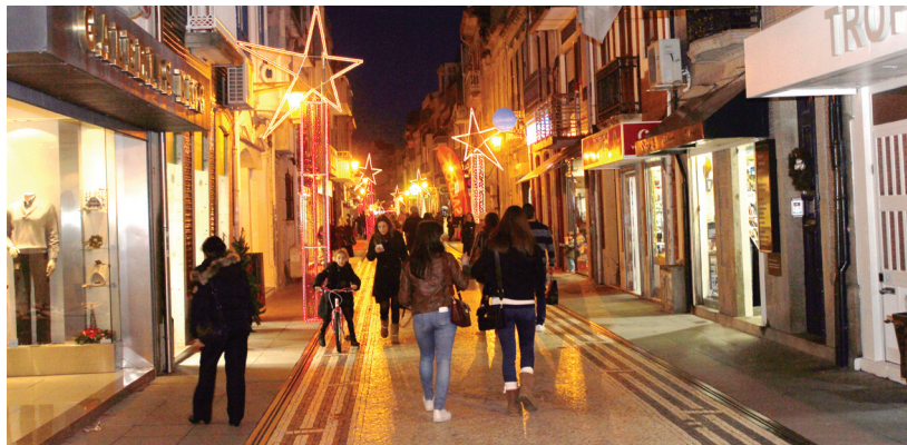
Rua da Junqueira

Este ano, o período de saldos mantém-se com data fixa de 28 de dezembro a 28 de fevereiro, entrando