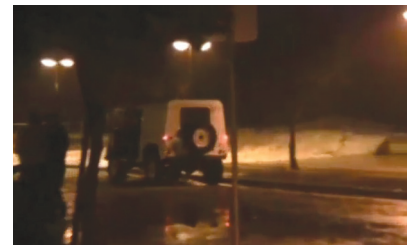
Janeiro - Mar invade Av. dos Banhos

- Os três homens da Póvoa de Varzim tiveram ainda a honra de serem recebidos pelo presidente da República, Cavaco Silva, que, na quadra natalícia, quis enaltecer o ato de honestidade e integridade destes funcionários camarários que tiveram o gesto de devolver o dinheiro encontrado no lixo. - No dia em que a festa de Natal invadia a Praça do Almada, marcando a chegada do Pai Natal, um homem de 54 anos baleou a ex-companheira, na rua do Boído. Foi detido e viria a suicidar-se na prisão. - O último mês do ano marca a grande surpresa no Instituto Maria da Paz Varzim. As eleições para a direção são disputadas por duas listas, a da recandidata Odete Costa e a de Deolinda Nogueira, pouco conhecida na instituição, o que não foi obstáculo a que vencesse o ato eleitoral (com mais 10 votos).