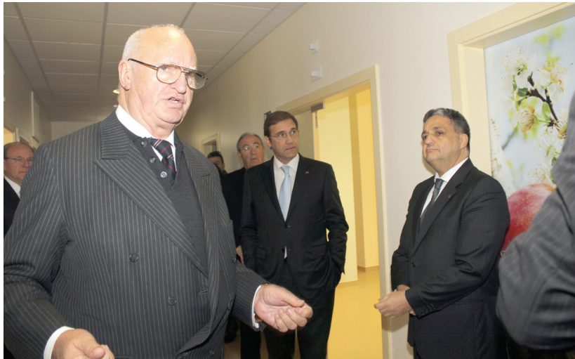
Visita às instalações

Os Hospitais Senhor do Bonfim, em Touguinhó, Vila do Conde, propriedade do empresário poveiro Manuel Agonia, foram inaugurados a 2 de dezembro pelo primeiro-ministro, que veio acompanhado pelo ministro da Saúde, Paulo Macedo.