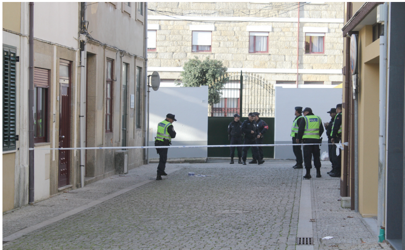
Rua do Boído

Casos de violência doméstica extrema registaram-se na Póvoa de Varzim, nas últimas semanas, de que resultaram vítimas mortais.